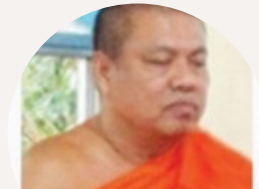
พระครูวิฑิตย์ธรรมสาร กรรมการผู้แทนพระภิกษุสงฆ์