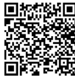
QR Code EIT1